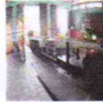
Left