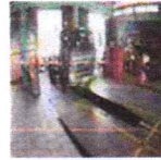
Left